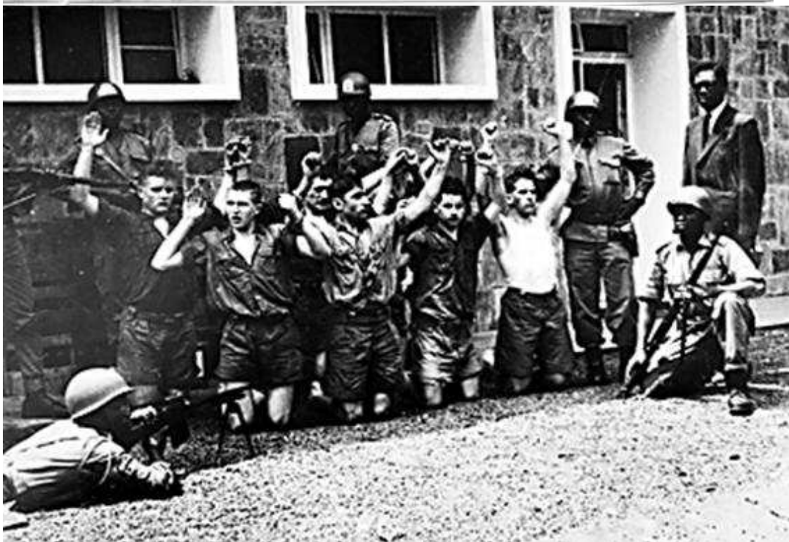
Foto genomen van ons in Bukavu overgoten met benzine.

Dit bericht is gecontroleerd door het NOD32 Antivirus Systeem.